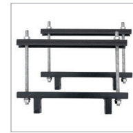
Fijación transversal Transversal fixation